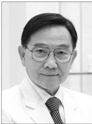
ศ.ดร.พิเชษฐ์ วิริยะจิตรา

รายใหม่ปีละกว่า 6,400 ราย ซึ่งหัวใจสำคัญทำให้ประเทศไทย ยืนหนึ่งเป็นประเทศแรกของโลก ที่สามารถช่วยผู้ติดเชื้อ HIV/AIDS ให้ Bye Bye HIV ได้เป็นผลสำเร็จ คือ การพัฒนาที่ไม่หยุดนิ่งของทีมนักวิทยาศาสตร์จากหลากหลายสาขาภายใต้ Operation BIM